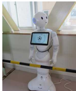
坂井中のペッパー君

坂井市の寄附市民参画制度の「AIロボットによる教育環境づくりプロジェクト」に寄せられた寄附金により、坂井市内の小中学校に1台ずつPepperが導入されます。(3年間の予定)(余談ですが、坂井市のホームページには、この寄附のメニューの一番最初に「日本酒『淵龍』再興プロジェクト」が出ています。)昨年度より実施されている新しい学習指導要領のプログラミング教育の充実を図るためです。